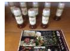
日本一売れているドレッシング『花様ドレッシング』