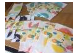
守山土産のオリジナルてぬぐい『もりぬぐい』

さて物販のお知らせです。オープン当初から震災復興を掲げ、販売しております熊本産ハンバーグ(2個580円)、同じくヨーグルト(1本600円)、絶賛好評販売中です。まだお召し上がりでない方はぜひ一度お試しください。また新商品として、守山市観光物産協会がお土産に作られた「もりぬぐい」(540円)、竣工記念に勝部自治会で作成した「火まつり交流館オリジナルタオル」(600円)、地元守山市木浜町で生産され、日本一売れている「花様(かよう)ドレッシング」(390円)などが加わりました。※全て税込 月~金の9時から17時、または土曜午前中にお買い求めください。ご来館の皆様のご要望にお応えしまして、自動販売機を設置しました。こちらもぜひご利用くださいませ。