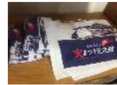
火まつり交流館でしか買えない『火まつり交流館オリジナルタオル』

飲食事業部「ポンテ」は平日10時から17時の営業です。せっかくお越しいただいても、満席でお入りいただけないお客様が多数いらっしゃいます。もしよろしければ一本お電話いただければ、お席の確保をいたしますので、お気軽にどうぞ。オリジナルオーダーケーキも大人気です。077-583-7738 「住よし」は3日前までの完全予約営業(平日夜と土日終日予約可)となっております。4名から10名様まで対応可能です。3,000円から旬のお料理7品で大満足の内容で、ご家族のパーティから、宴会・歓送迎会、法要までご利用いただいております。こちらも上の電話番号でご予約を受け付けておりますのでどうぞ。