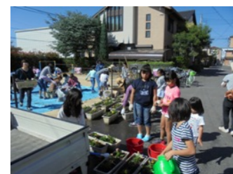
平田海道公園でもたくさんの子も達が作業に参加してくれました。