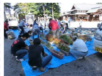
子ども会と環境推進員のみなさんが一緒になって植え替えの作業を行ないました。

10月15日(土) 勝部神社境内において、秋の花いっぱい運動を行いました。1,200株のパンジーの苗が、子ども会さんと環境推進員さんにより植え替えられました。