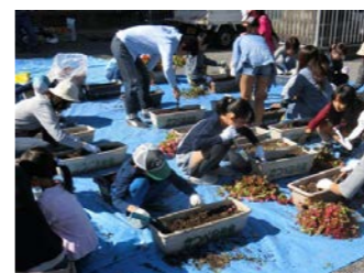
勝部神社境内での作業は春に続いて2回目です。