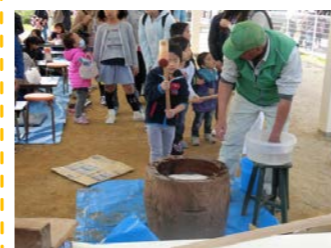
今年も餅つき体験は盛況で、子ども達の列が途切れませんでした。

11月6日(日) 3丁目のエルセンターにてかつべ文化祭を開催しました。今年は自治会館の改築工事もあり、会場を3丁目のエルセンターに移しての開催となりました。