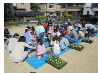
今回も勝部神社と平田海道公園の2か所に分かれて作業しました。