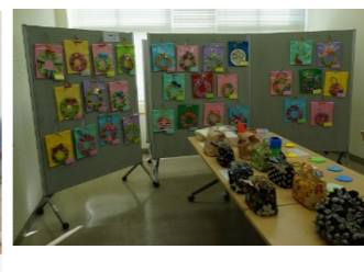
手芸や陶芸など、勝部の皆様の手がけが展示されました。