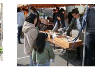
各種団体の皆さんによるいろいろな模擬店。