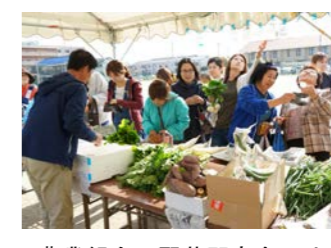
農業組合の野菜即売会には勝部産の新鮮野菜がならびました。