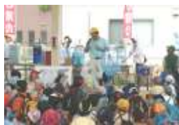
自治会長のあいさつで開会しました。

川の体験学習の後、エルセンターに戻って、かき氷を食べました。今年は晴天に恵まれ炎天下となりましたので、かき氷も飛ぶように売れました。そのあと、子ども会さんによる絵合わせゲームを行ない、子どもたちは色々な景品を手に入っていました。最後に金尾先生より今回の総括を頂き、第7回 水フェスタを締めくくりました。