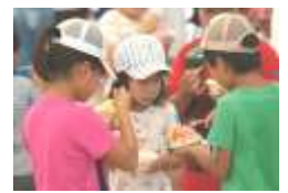
炎天下のかき氷はやっぱりおいしい。