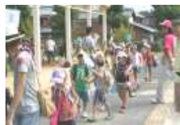
勝部ホテル南の道(中水川)に移動します。