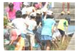
子どもたちは一生懸命 魚を追いかけました。