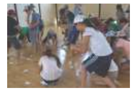
今回 初企画の絵合わせゲーム、何の絵が合わさったかな？