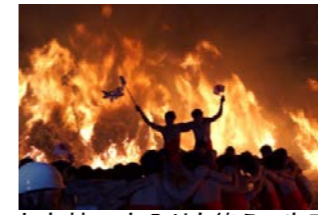
大太鼓の宮入りも終え、牛玉参りを終えた後、鳥居前の街道に並べられた大松明が境内に次々と運び込まれました。8時55分頃、整列を終えた大松明に勝部神社本殿より御神火が“火出し人”より“火受け人”に授けられ、そして大松明に奉火されました。12基の大松明の炎は天空を焼き、大太鼓に閉じ込めた町内の厄を焼き尽くしました。