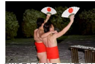
副組長と各部長には扇子と提灯が授与されます。