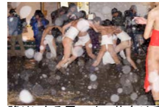
降りしきる雪の中、若衆は乱舞しながら神社からの使者を待ちます。

1月14日(土) 県選択無形民俗文化財『勝部の火まつり』が執り行われました。朝からちらついていた小雪も夕方には本格的な雪となるあいにくの天気でしたが、寒空を貫く若衆の声は町内の邪気を振り払い、勝部に新しい年を呼び込みました。