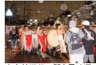
大太鼓巡行の間も雪は深々と降り続けました。