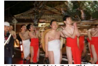
3基の大太鼓はそれぞれの行く先で町中の厄を大太鼓に封じ込めていきます。