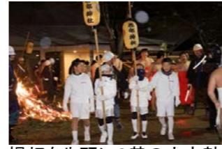
提灯を先頭に3基の大太鼓がそれぞれ町内巡行に繰り出します。