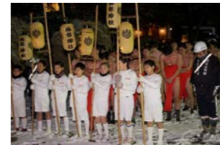
若衆・世話方全員で神社に参拝し、まつりの無事を祈願します。