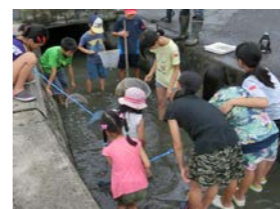
川の学習では必死に魚を追いかけます。