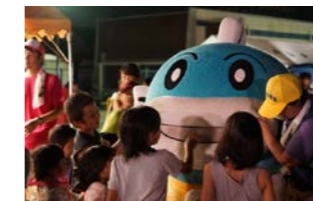
キャフィーとのふれあい