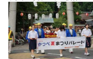
オープニングパレード