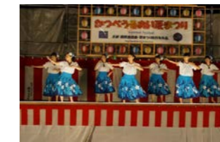
町民有志によるフラの披露