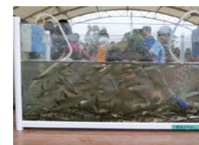
水槽いっぱい魚が採れました。