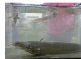
体長30センチのナマズも採れました。