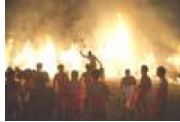
午後8時40分過ぎ、本殿よりだされた御神火により、大松明に奉火されます。このときに大太鼓をたたき町内の役を焼き尽くします。