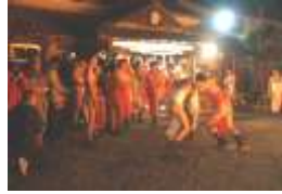
午後5時45分頃から住吉会館前で神社からの使者を待ちます。