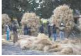
9日早朝より松明の先端に菜種がらを取りつけます。

1月9日(土) 勝部神社において『県選択無形民俗文化財 勝部の火まつり』が晴天の中、執り行われました。午後6時過ぎ、神社へのお参りを済ませた若衆達が太鼓を担いで町内の厄を集めて回り、午後8時40分過ぎ、奉火された松明の炎は、睦月の空を焦がす勢いで燃え上がり、町内の厄を燃やしつくしました。 祭の様子は勝部自治会facebookからも確認できます。自治会ホームページfacebookボタンからご覧ください。