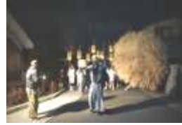
神社からの使者を先頭に祭前のお参りをします。