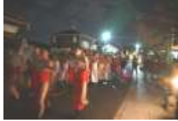
大太鼓3基が町内を練り歩き、積もった町内の厄を大太鼓の中に集めて回ります。