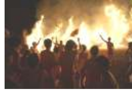
午後8時40分過ぎ、本殿よりだされた御神火により、大松明に奉火されます。このときに大太鼓をたたき町内の役を焼き尽くします。