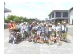
日本バイリン前で記念撮影。