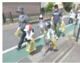
みんなでゴミを拾いながら歩きました。

去る、5月24日(日)『ふれあいウォーキング』を実施いたしました。前日までは怪しい天気予報が続き、当日もはじめのうちは曇り空でしたが、元気な皆さんの姿に、途中から晴天に変わりました。今回は、勝部町内にある企業や店舗を巡り、勝部に古くからある、この工場は何を作っているのか、この店舗では何を専門に行われているのか、色々と学んでいただきました。色々な専門技術や専門家がいらっしゃることを知っていただけました。自治会館に帰着後は、各種団体の皆さんが提供してくださった料理で、親睦会を開きました。おにぎりやフランクフルト・そうめん・三色だんごやげんこつ飴など、たくさんの料理を提供して頂きましてありがとうございました。ご協力いただきました企業のみなさまありがとうございました。