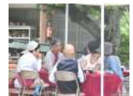
会館前公園ではオープンカフェが開催されました。