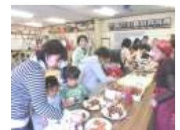
帰着後は各種団体のみなさんが用意してくださった料理で懇親会。