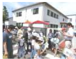
東レ・ファインケミカル様では担当者さまよりご説明いただきました。